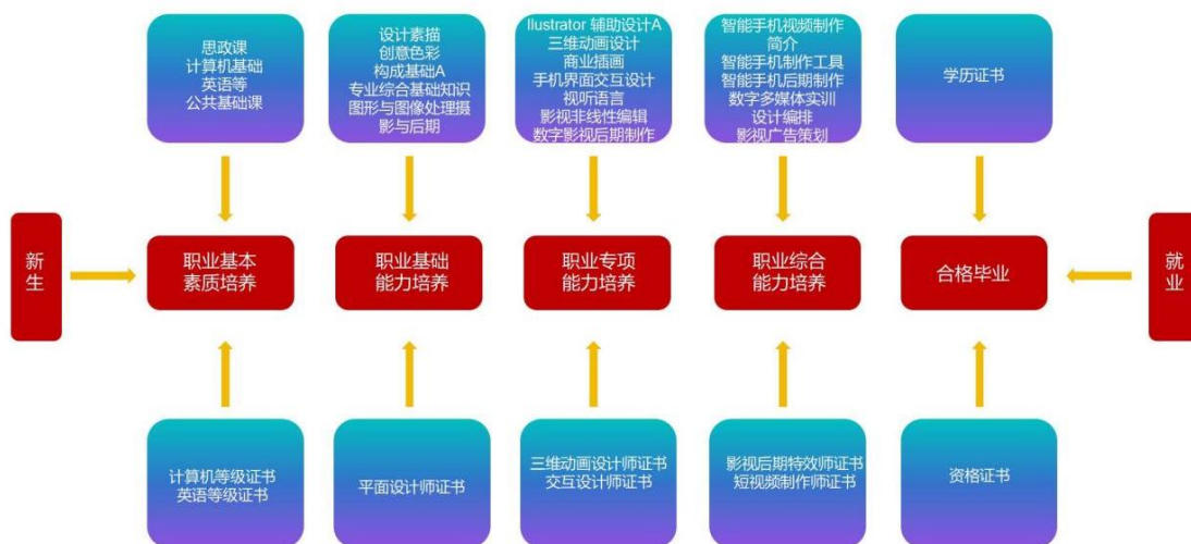
图 2 课程体系与职业能力之间的匹配关系

课程体系的设置服务于专业能力结构的要求，整个课程体系划分为公共课、专业基础课、专业核心课、专业拓展课、毕业实践等五大模块，为学生逐步构建职业基本素质、职业基础能力、职业专项能力和职业综合能力，以适应职业面向与岗位需求。