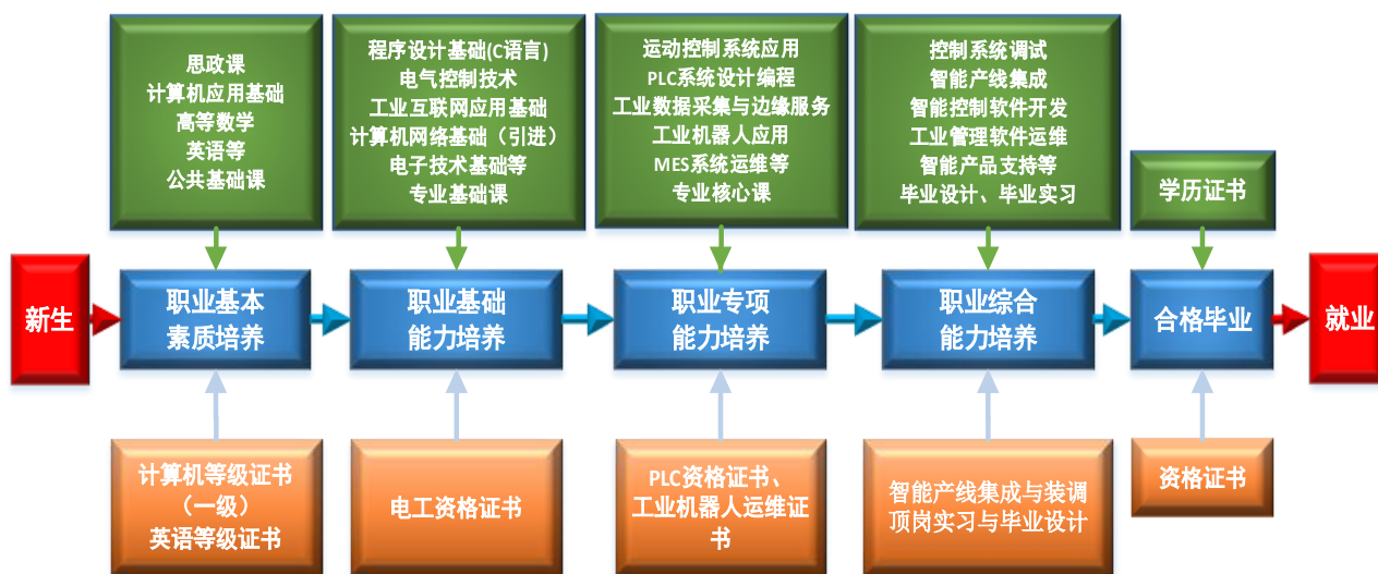
图 2 课程体系与职业能力之间的匹配关系

课程体系的设置服务于专业能力结构的要求，整个课程体系划分为公共课、专业基础课、专业核心课、专业拓展课、毕业实践等五大模块，为学生逐步构建职业基本素质、职业基础能力、职业专项能力和职业综合能力，以适应职业面向与岗位需求。